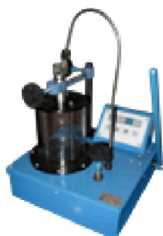
Стенд электронный для испытания и регулировки форсунок М-106Э