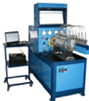
Стенд для испытания и регулировки ТНВД СДМ-12-03-15