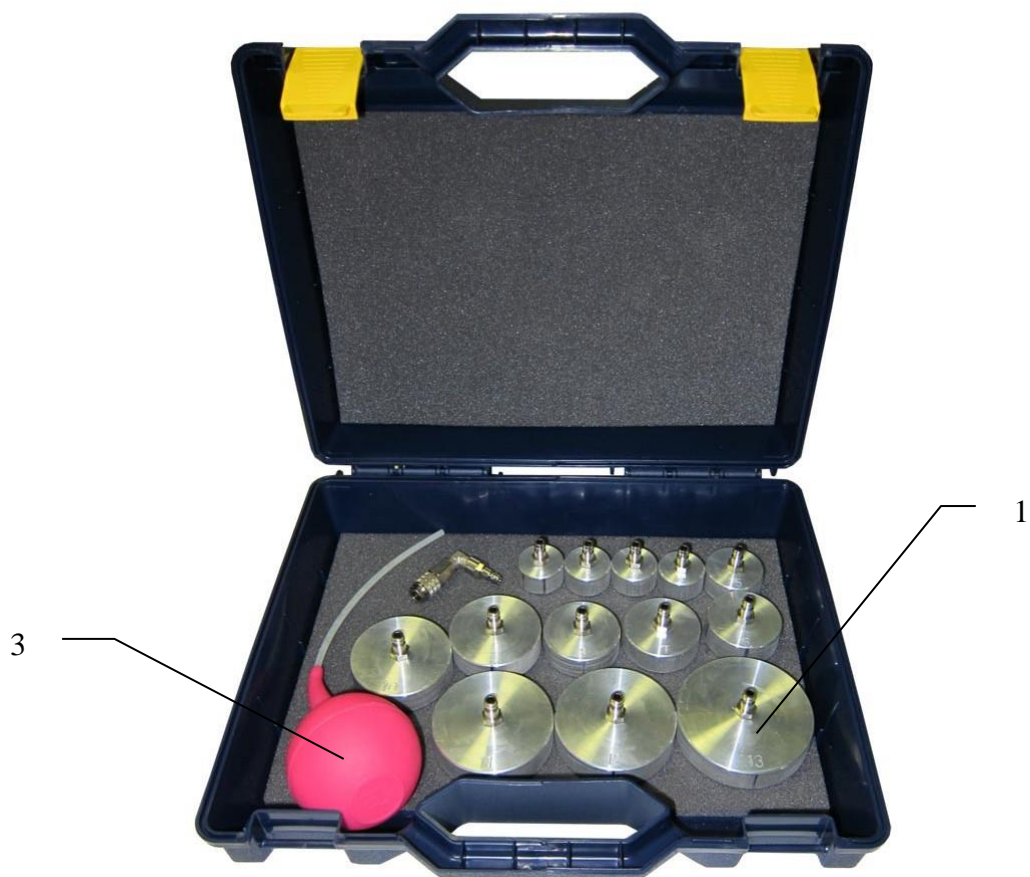
Рис.3 (набор адаптеров)