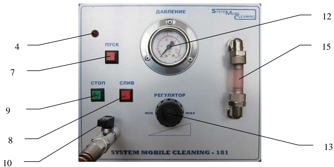
Рис.2 (передняя панель)