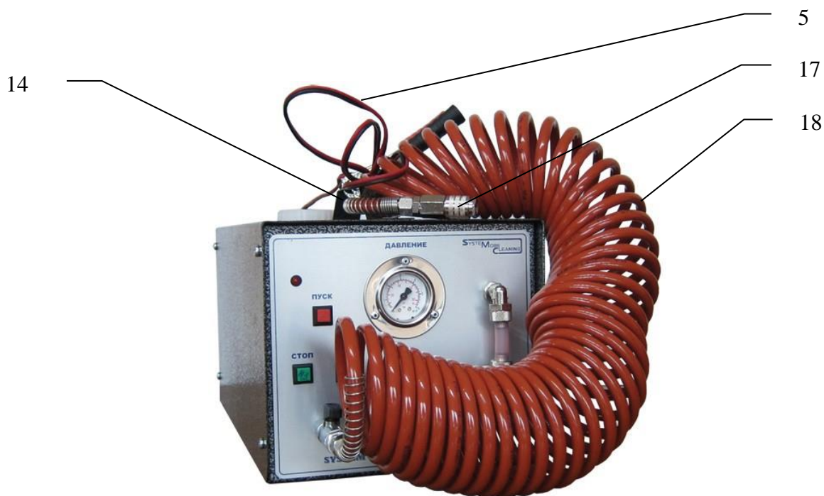
Рис.1 (вид спереди)