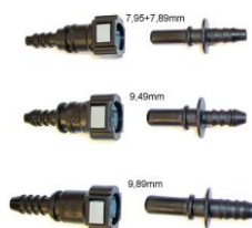
Набор пластиковых адаптеров