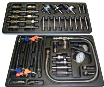
Рисунок 1. Расположение фитингов в ложементах

Колёса и ручки для перемещения на корпусе установки не закреплены. После распаковки их необходимо закрепить по месту.